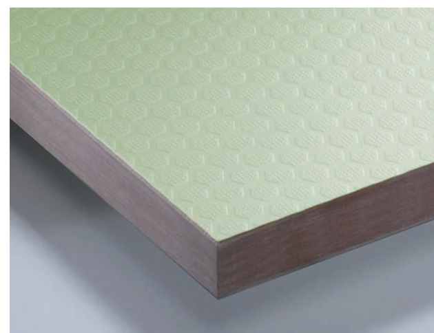
Vista parcial de la superficie Hexa