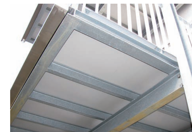
Subestructura vista del suelo del balcón