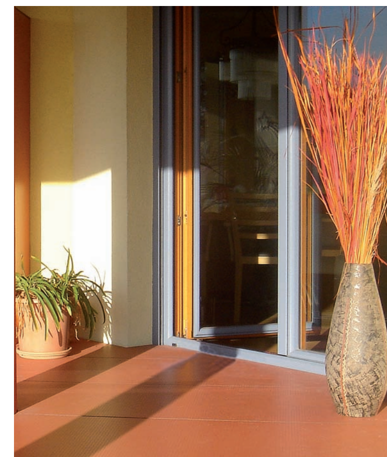
Campo de aplicación: Terraza antideslizante

Podrá consultar las instrucciones de montaje en Instrucciones de Montaje de Tarimas/Cassettes y en nuestro catálogo Técnico Exterior.