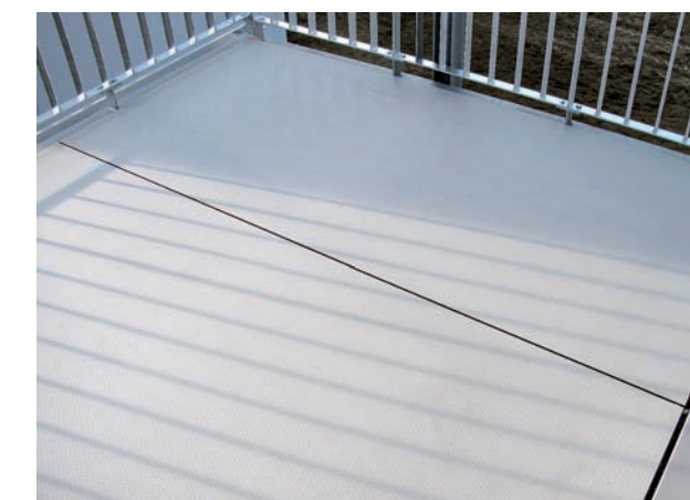
Placas para suelos de balcón con superficie Hexa