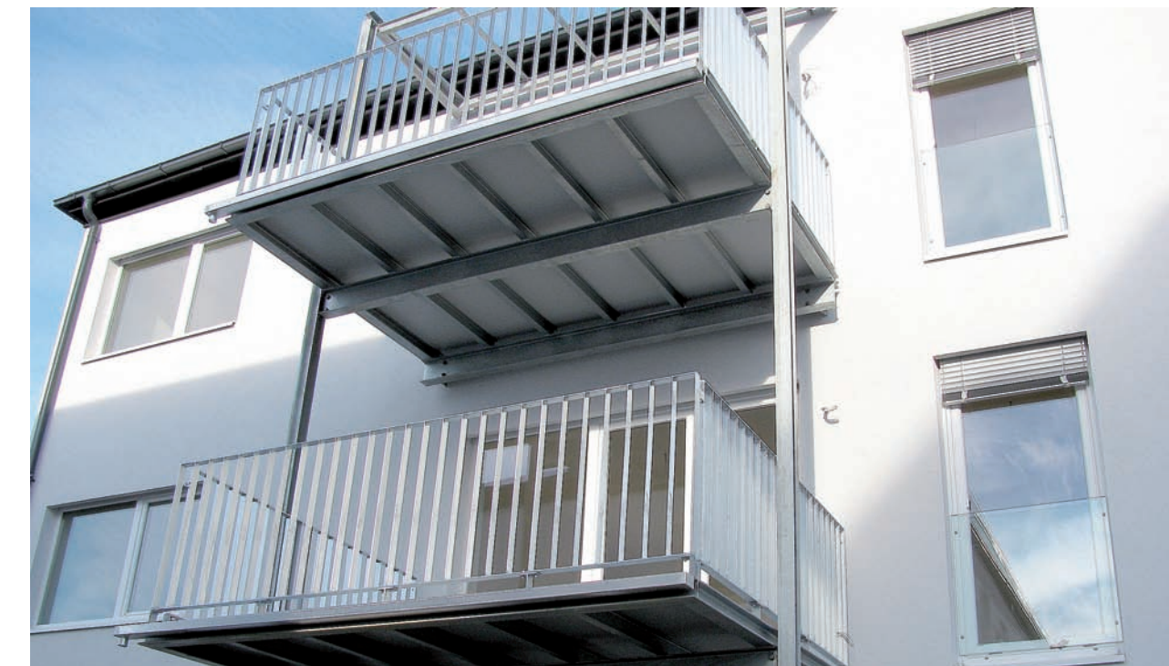
Balcones ampliados con las placas para suelos de balcón Max Exterior