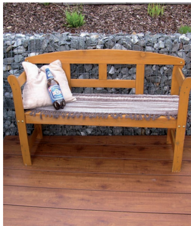
Suelos elevados para terrazas

El programa de placas para suelo se complementa con accesorios como las pinzas de sujeción. Véase el programa de suministro de paneles con superficie Hexa.